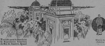
Fuere para la Exposición de la Exposición brasileña de Rio de Janeiro, Brasil